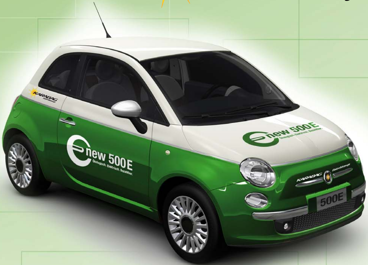
Abb. zeigt Sonderausstattung.

Ökologisch. Elektrisch. Bezahlbar. New 500E – der günstige Stadt-Stromer.