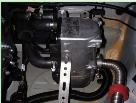
| Position unter Rücksitzbank

Alternativ zum reinen Ethanolbetrieb verträgt die Heizung auch bis zu 15 Prozent Benzinbeimischung. So kann bei Bedarf an jeder Tankstelle getankt werden, die eine E85-Zapfstelle hat.