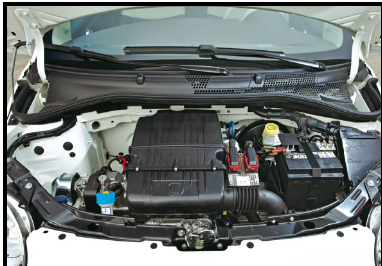
FIAT 500 Der kleine 1,2-Liter-Vierzylinder passt locker unter die kurze Haube. Im Vergleich zum großen Kasten im Karabag (unten) wirkt er fast bescheiden