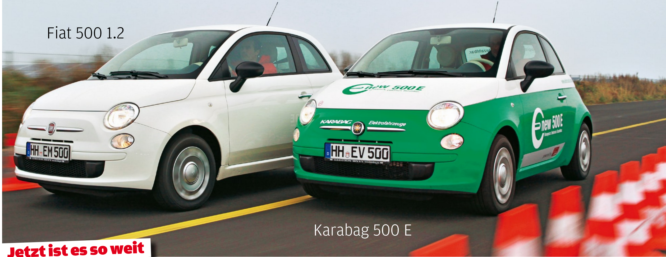
Fiat 500 1.2