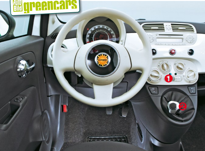
KAUM UNTERSCHIEDE Die Cockpits der beiden Autos sind bis auf zwei Punkte identisch: die Knöpfe der Ethanol-Heizung (1) und der Automatikwählhebel (2)