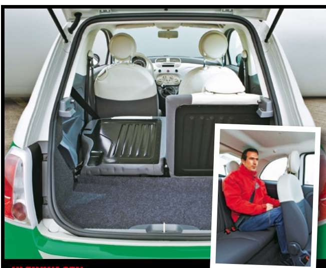
KLEINWAGEN Während der Platz auf den Vordersitzen in Ordnung geht, wird es in Reihe zwei selbst für Kinder eng. Der Kofferraum ist mit 185 Litern arg klein geraten

Leasing ohne Anzahlung, 48 Monate Laufzeit, 7500 km jährliche Laufleistung beim Fiat - Karabag ohne Laufleistungsbegrenzung; Monatsraten gerundet; Angaben laut Herstellerbanken, ohne Gewähr