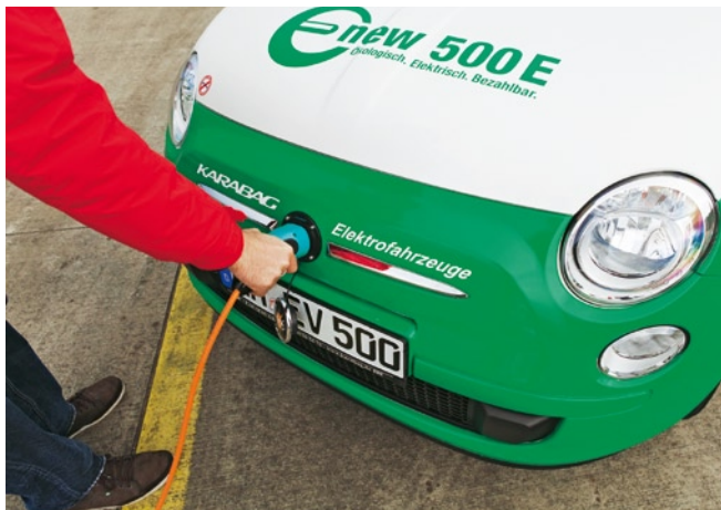
Unter dem Firmenlogo des Karabag versteckt sich die Ladedose. Der 500 E kann an jeder normalen Haushaltssteckdose aufgeladen werden

* Keine Bewertung, da Fahrzeugrückgabe nach Leasing-Ablauf