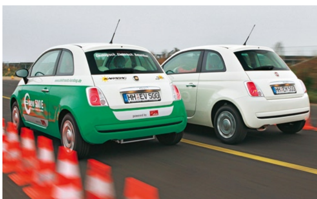
Nachteil Elektroauto: Der Fiat 500 (rechts) beschleunigt deutlich besser als der elektrisch angetriebene Karabag 500 E