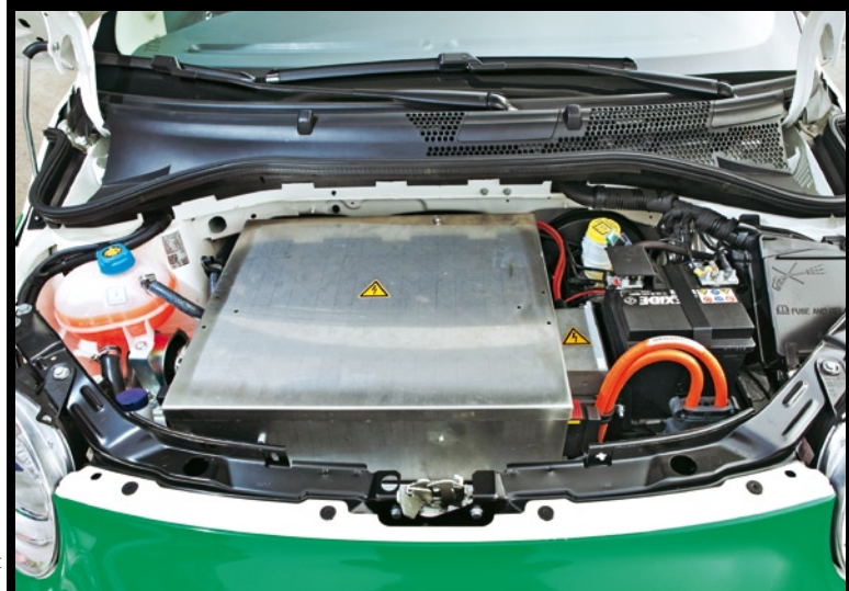
KARABAG 500 E Karabag bringt neben dem Elektromotor und einem der beiden Akkus die komplette Elektronik unter der Fronthaube unter